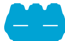
vaschette uova vuote