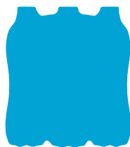
imballaggi in plastica