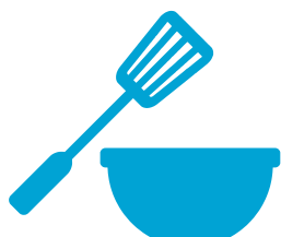
utensili da cucina in plastica o silicone