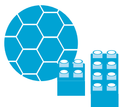
giocattoli e palloni