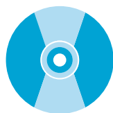
CD e DVD