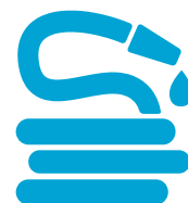
tubi elettrici, idraulici e per l'irrigazione