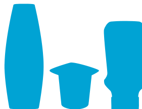
flaconi shampoo, flaconi salse e barattoli yogurt