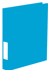
cartelline in plastica