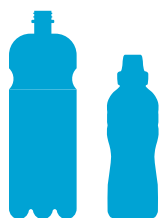
bottiglie di plastica e film esterno