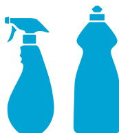
flaconi detersivo e nebulizzatori