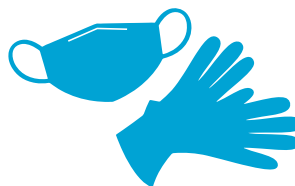
mascherine e guanti monouso