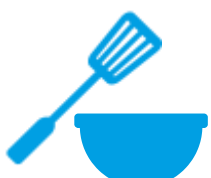
Utensili da cucina in plastica o silicone INDIFFERENZIATO