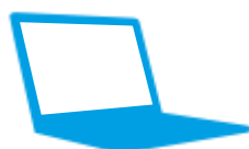
Oggetti elettronici RAEE c/o C.D.R.