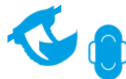
Pannolini e assorbenti INDIFFERENZIATO O SACCO VIOLA