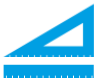
Righelli e squadre INDIFFERENZIATO