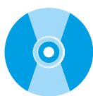
CD e DVD INDIFFERENZIATO