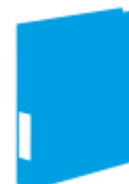
Cartelle in plastica INDIFFERENZIATO