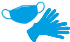
Mascherine e guanti monouso INDIFFERENZIATO