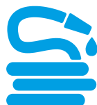
Tubi elettrici, idraulici e per l'irrigazione INDIFFERENZIATO